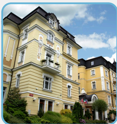
Spa Hotel San Remo