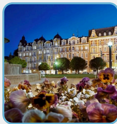
Spa Hotel Palace Zvon