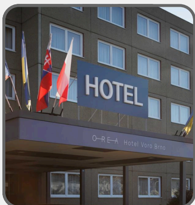
Hotel Voro Brno