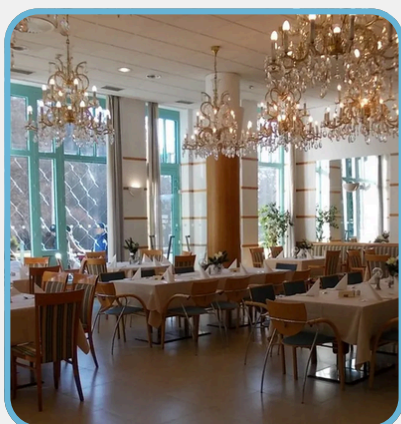
Spa Hotel Cristal