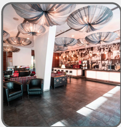
Hotel Angelo Praha