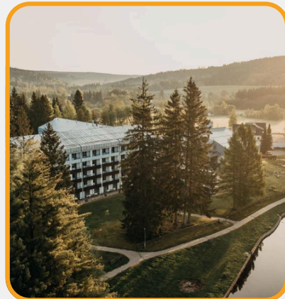
Resort Devět Skal