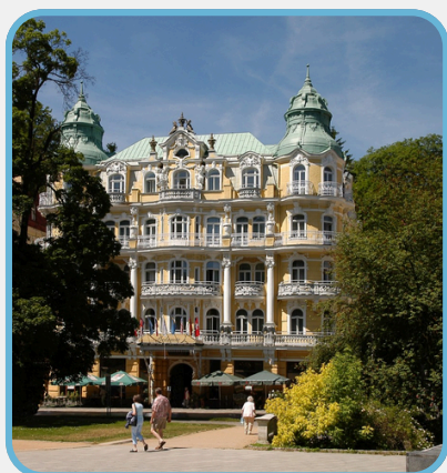
Spa Hotel Bohemia