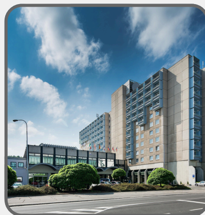
Congress Hotel Brno