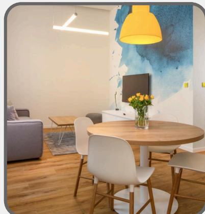
OREA Place Seno